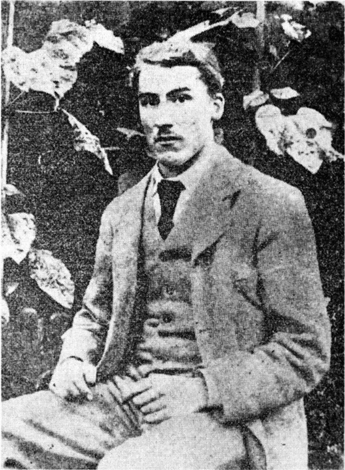
Howard Carter a 25 anni