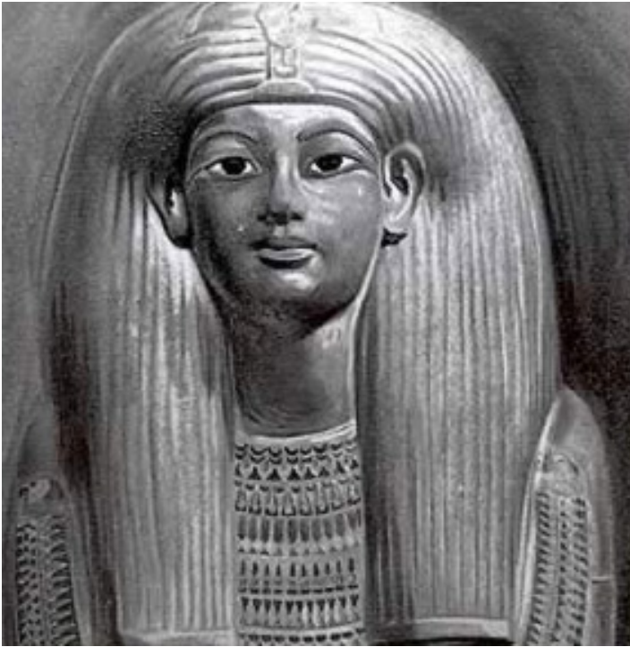
Tutankhamon dipinto da Howard Carter