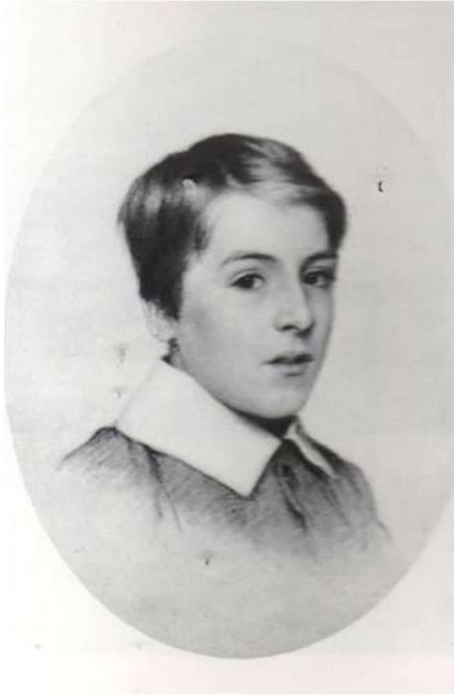
Howard Carter da ragazzo.