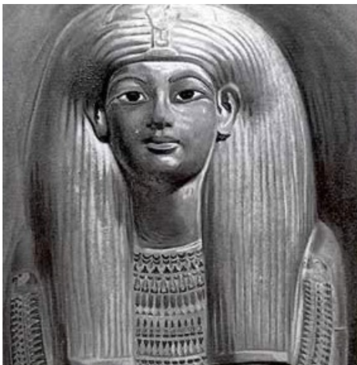
Tutankhamon dipinto da Howard Carter

"Diedi l'ordine. Fra il profondo silenzio, la pesante lastra si sollevò. La luce brillò nel sarcofago. Ci sfuggì dalle labbra un grido di meraviglia, tanto splendida era la vista che si presentò ai nostri occhi: l'effigie d'oro del giovane re fanciullo" (Howard Carter, archeologo vissuto realmente)